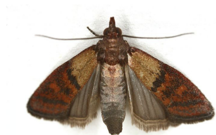
Fig. 6 - Plodia interpunctella