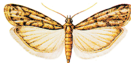
Fig. 4 - Ephestia kuehniella