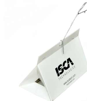
Fig. 2 - Armadilha Delta de papel