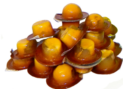
Fig. 1 - TECHLURE TRAÇA