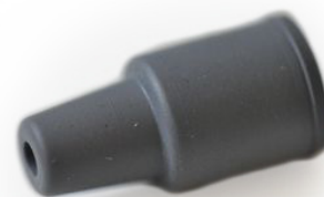
Fig. 1 - TECHLURE