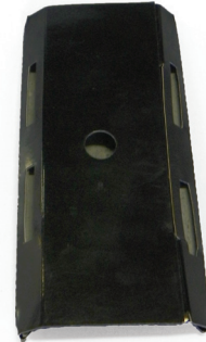
Fig. 2 - Armadilha Fina