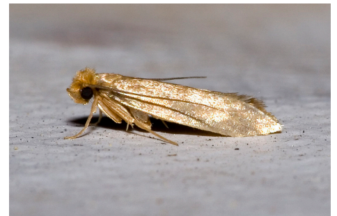
Fig. 4 - Traça de Roupas - Tineola bisselliella