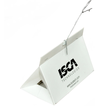
Fig. 2 - Armadilha Delta de papel