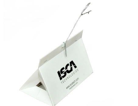
Fig. 2 - Armadilha Delta de papel