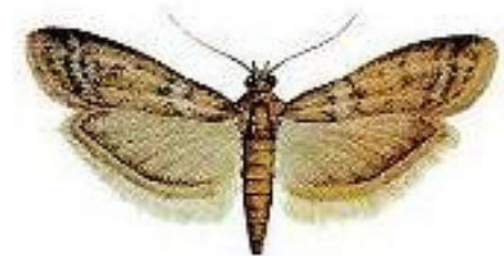
Fig. 4 - Mariposa Cadra cautella